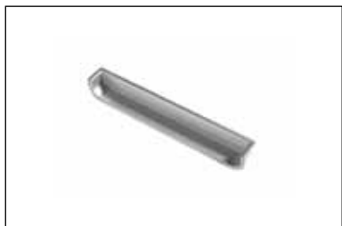
Art. 156 (Maniglia per programma a scomparsa)