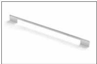
Art. 552 (Passo 320 mm)