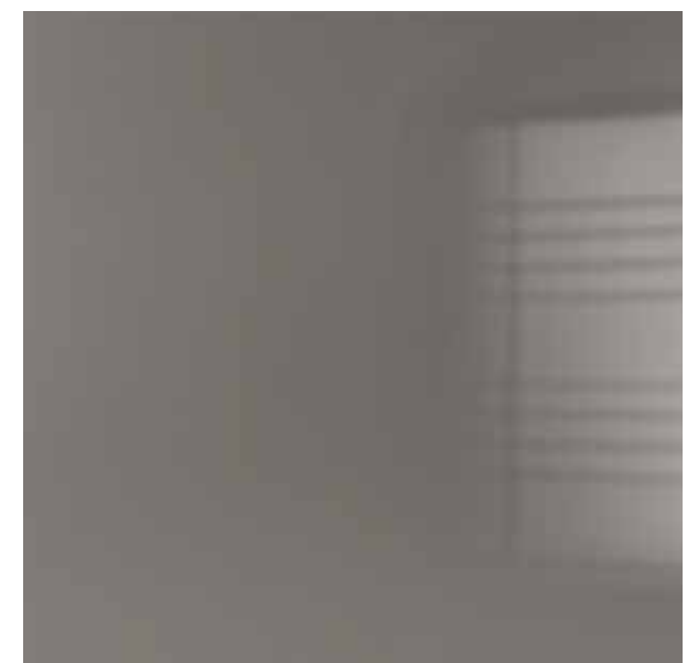
Laccato Lucido Spazzolato Matita