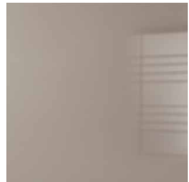
Laccato Lucido Spazzolato Tortora