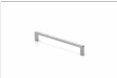
Art. 250 (Passo 160 mm) di serie