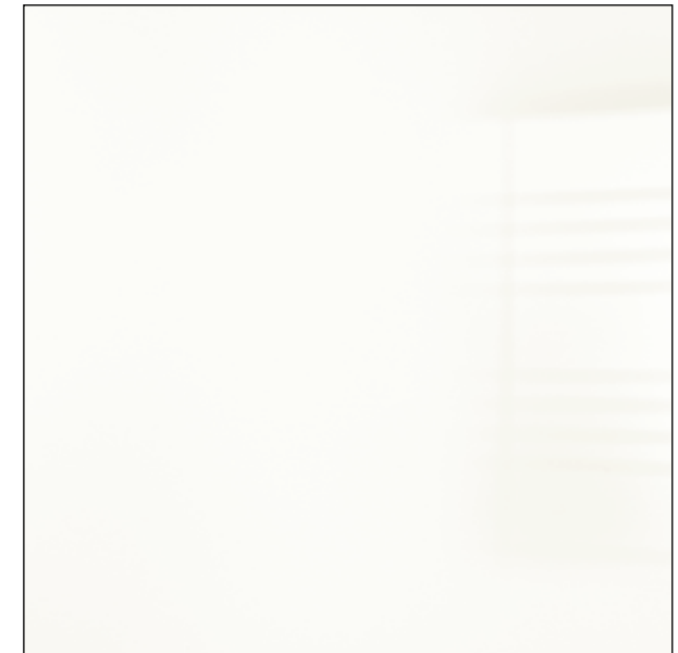
Laccato Lucido Spazzolato Seta