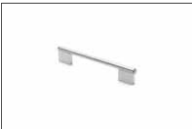
Art. 251 (Passo 160 mm)