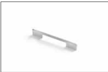
Art. 252 (Passo 160 mm)