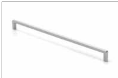
Art. 550 (Passo 320 mm) di serie